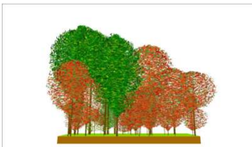
Figura 2 – Esempio di transect strutturale, prospetto