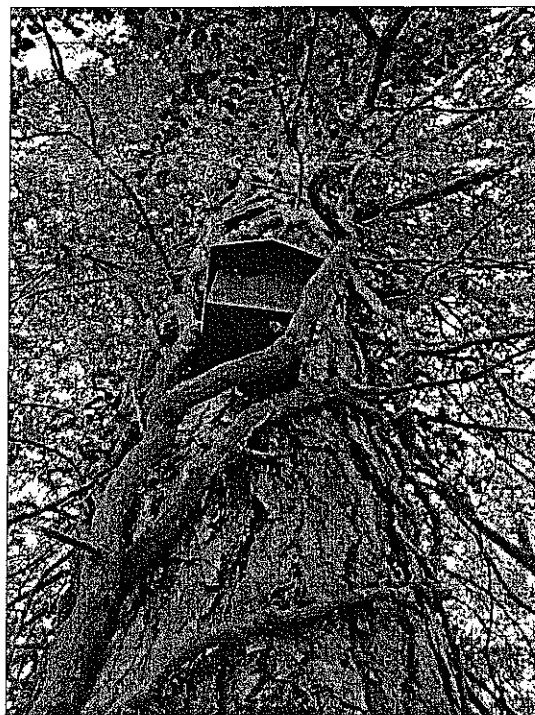
Illustrazione 1: vecchio esemplare di edera cresciuta su di un pino nero secolare

Il Vivaio Castellaro è ubicato su un terreno nei pressi della frazione S.Giacomo, a ridosso del confine fra i Comuni di Galeata e Santa Sofia. Ha un'estensione complessiva di Ha 8,80, articolata su più gradoni.