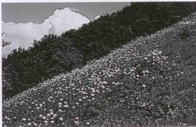
Fig. 1 - Popolazione di T. europaeus fotografata nel 1998