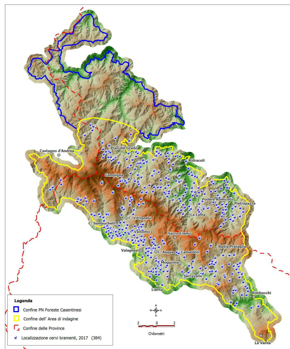
Tavola 2: localizzazione dei cervi maschi bramenti nell'area di indagine del Parco, anno 2017. (Orlandi et al. 2018)